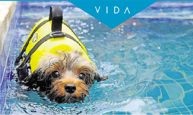
JONAS RAMOS, BO, 11/03/2014