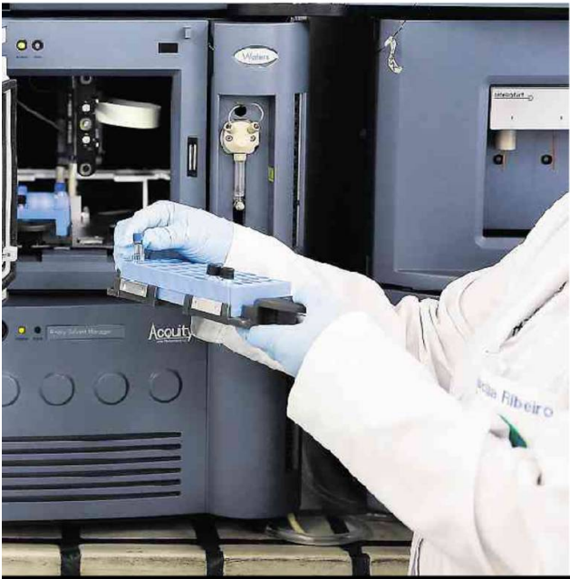
EXPERIMENTOS EM LABORATÓRIO