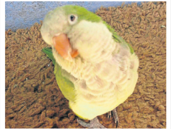
COTA: a caturrita da Angélica Correia faz pose