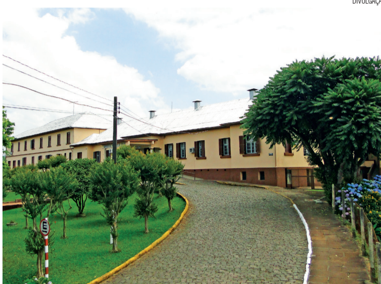
Hospital de Marques de Souza faz jantar no dia 18, na União Centenária

Os cartões para o jantar são vendidos de forma antecipada até quinta-feira, 16, ao preço de R$ 20 por pessoa no hospital, fruteira