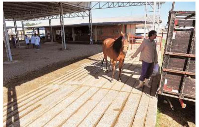
Depois do fluxo da madrugada, últimos animais foram embarcados à tarde